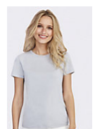
SOL'S REGENT WOMEN 01825