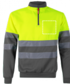
RICAMO Maglietta | Lato destro 150 x 150 mm