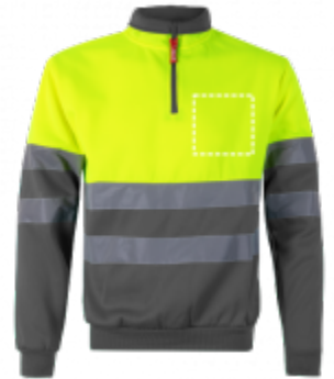
RICAMO 3D Maglietta | Lato destro 150 x 150 mm