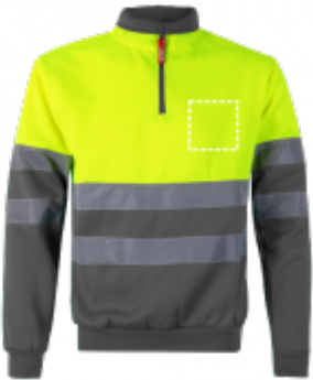
STAMPA TRANSFER Maglietta | Lato destro 100 x 100 mm