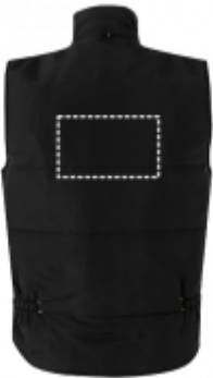
STAMPA TRANSFER Gilet da lavoro | Retro 300 x 180 mm